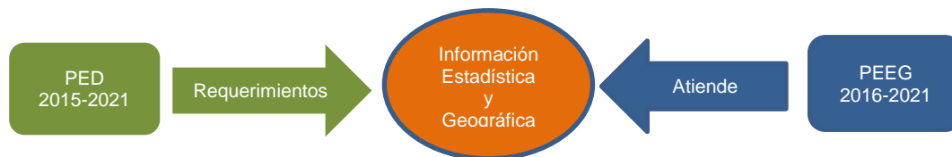
FIGURA 1 RELACIÓN DEL PED Y EL PEEG

Para implementar la estrategia de innovación y modernización e iniciar la transformación hacia un gobierno abierto y digital, la administración estatal desarrollará una plataforma tecnológica de información que fomente una nueva relación entre sociedad y gobierno, centrada en el ciudadano como usuario de servicios públicos. En el objetivo B de este Eje, la estrategia B.3 plantea como una línea de acción, fomentar el acceso de la sociedad a los datos públicos mediante estándares abiertos, así como facilitar la interoperabilidad de los sistemas de información del gobierno. De la misma manera, el objetivo C promueve en su estrategia C.1, asegurar que la información pública sea accesible y se difunda con claridad, sencillez y oportunidad al ciudadano.